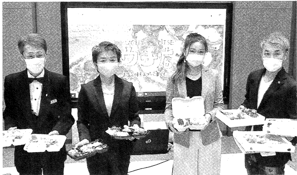
弁当などを紹介する飲食店主ら(画面は「ウチ店」のサイト)

岐阜商工会議所と柳津町商工会、岐阜市は20日、岐阜市内でテークアウトやデリバリーを行う飲食店の情報を集約したウェブサイトを「ウチ店(うちみせ)」を開発した。3者で連携をとりながら、コロナ禍で売り上げ減に悩む飲食店を支えるのが狙い。岐阜会議所・柳津商工会では、同サイトを活用して専門家による衛生管理の指導を行うなど、飲食業の経営支援を深化させた(岐阜)