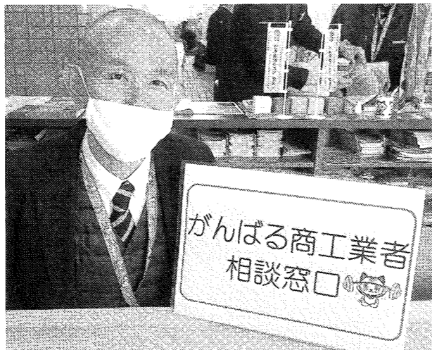
常滑市役所1階の商工観光課に設置した「がんばる商工業者相談窓口」

【常滑】常滑市は、新型コロナウイルス感染拡大の影響を受けた市内の飲食店を支援するため、緊急経済対策として「買ったコ!とこめし応援券」の販売を開始する。応援券の売上金を先払いすることで、当面の運転資金に充ててもらい、事業の継続を支援する。(常滑)